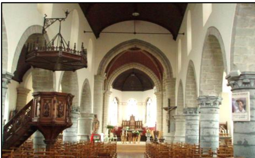
Denderhoutem. ...de St.-Amanduskerk van Denderhoutem die Dom Chris vanaf zijn negen jaar als 'zijn' kerk bezag...

Op zaterdag 22 november 2003 om 11.15u. werd ook in de parochiekerk St.-Amandus te Denderhoutem een nadienst gehouden.