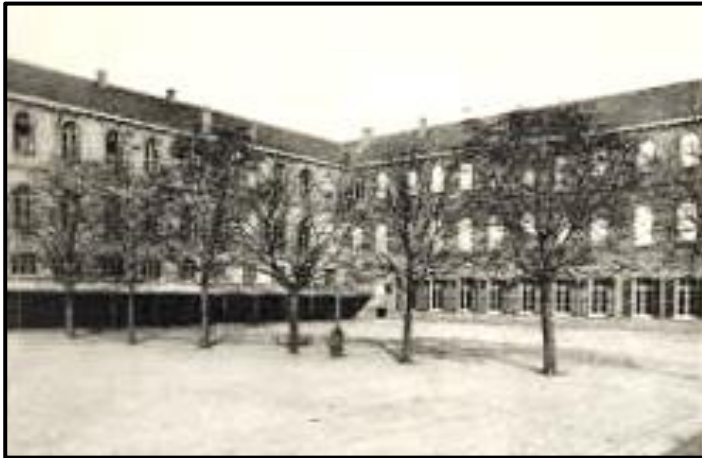
St.-Niklaas. ...normaalschool, internaat bij de broeders van de Christelijke Scholen...

de Christelijke Scholen te Sint-Niklaas. 1 Hij behaalde er het diploma van onderwijzer in 1944.