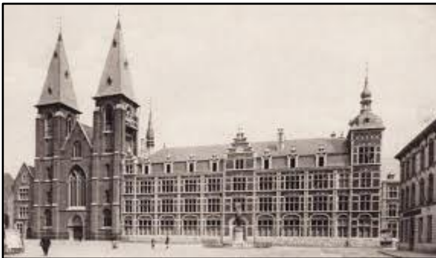
Dendermonde. ...St.-Pieters- en Paulus- abdij met ingang aan de Vlasmart naast de twee stoere torens van de basiliek....

Op 12 augustus 1944 mocht hij zijn noviciaat beginnen en hij kreeg een nieuwe naam: "Chrysostomus";