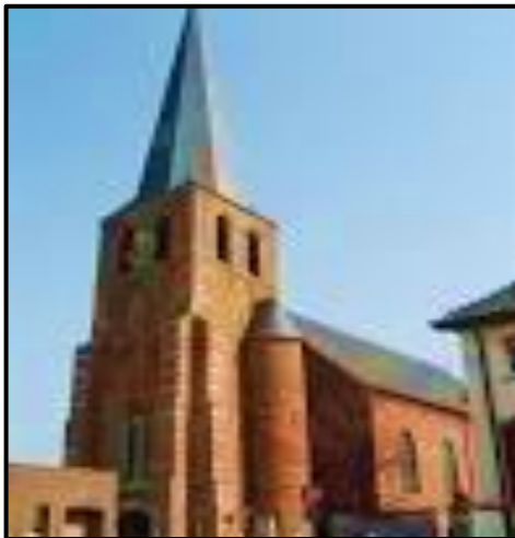
Michelbeke. ...St.Sebastiaankerk van Michelbeke...